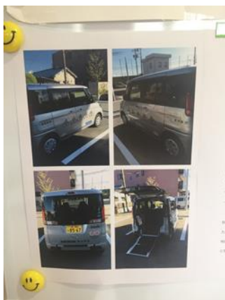
・福祉車両の概要