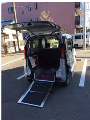
・車椅子使用時のスロープ